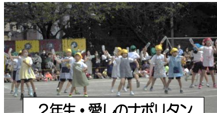
2年生・愛しのナポリタン