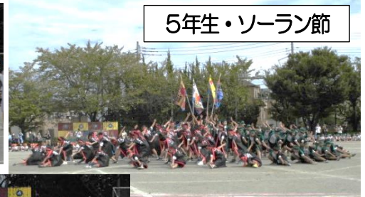
5年生・ソーラン節